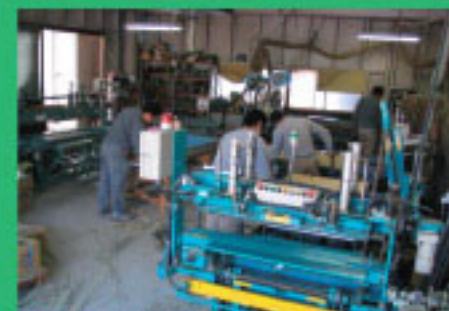
最新鋭の設備と熟練のスタッフ