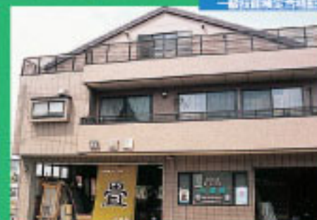
本社工場(三軒町通り沿い)